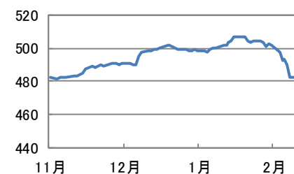
過去3か月の優先リート推移 (ICE BofA Merrill Lynch 優先リート・インデックス)

■当資料はパインブリッジ・インベストメンツ株式会社によって、ファンドに関する参考データを受益者の皆様にご提供する目的で作成された資料であり、販売用資料ではなく、また法令に基づく開示書類でもありません。■当資料の情報は原則として上記作成日現在のものですが、将来の成果や利回り等を保証するものではありません。また、将来の市場環境等の変動により当該運用方針が変更される場合があります。